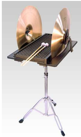
MPS-300 マルチパーカッションスタンド