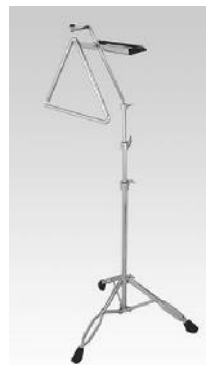
TRS-120 トライアングルスタンド