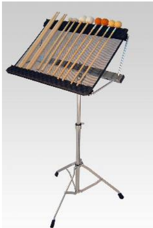
9450 ネット式マレットスタンド