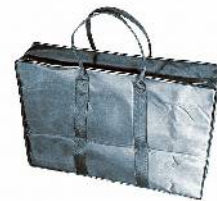
MCC-10 マレットスタンドケース