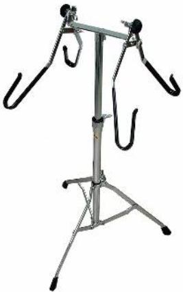
360 コンサートシンバルスタンド

詳細につきましては、ホームページ http://www.aidagakki.com をご覧ください。