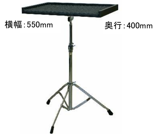
9350 マレットスタンド