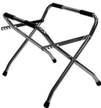
319 バストラムスタンド