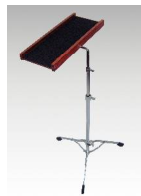
MTY-1ST マルチ・トレースタンド