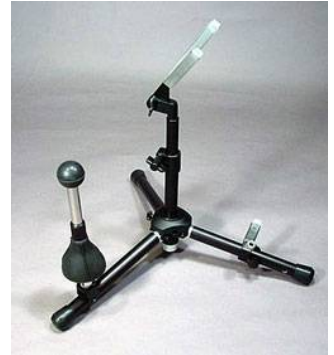
SX-95A (13P別売り) アルト/テナーサックススタンド