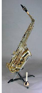
9103 (9112CFP別売り) アルト/テナーサックススタンド