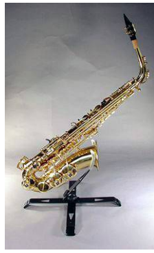
ASS-100 (13P別売り) アルトサックススタンド