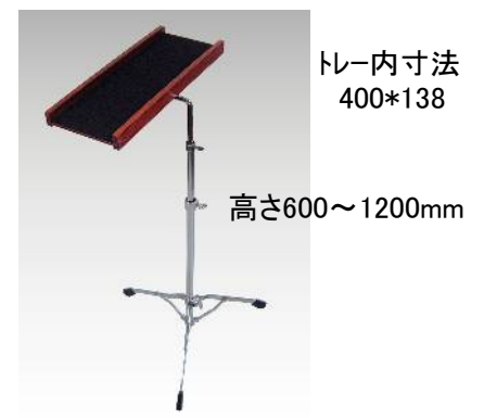
MTY-1ST マルチ・トレースタンド