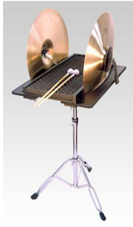
MPS-300 マルチパーカッションスタンド