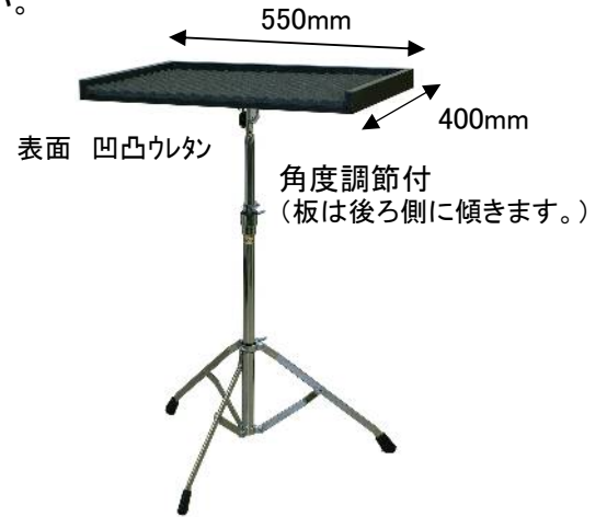
9350 マレットスタンド