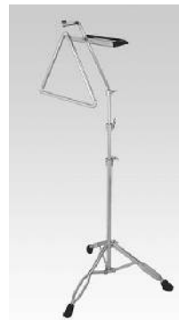
TRS-120 トライアングルスタンド