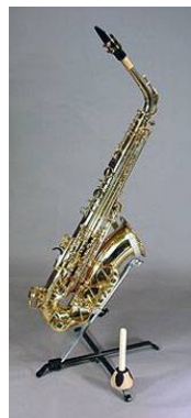
9103 (9112CFP別売り) アルト/テナーサックススタンド