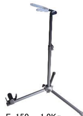
F-150 1.0Kg バズーン(ファゴット)スタンド