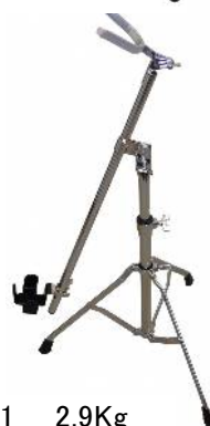
1091 2.9Kg バズーン(ファゴット)スタンド