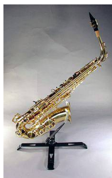
ASS-100 アルトサックススタンド