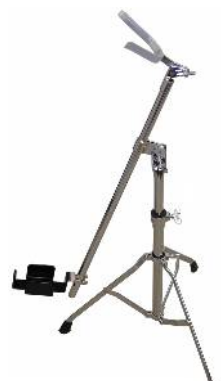
1081 3.0Kg アルト/バスクラリネットスタンド