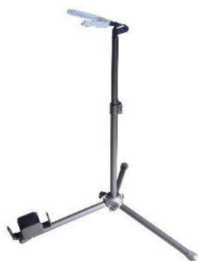
BC-150 1.2Kg アルト/バスクラリネットスタンド