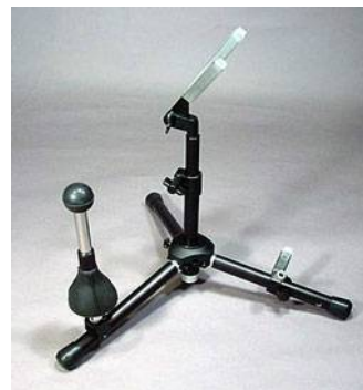
SX-95A (13P別売り) アルト/テナーサックススタンド