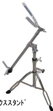
1041DX バリトンサックススタンド