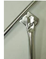
1041DX 1081 1091 共通ボルトとナット